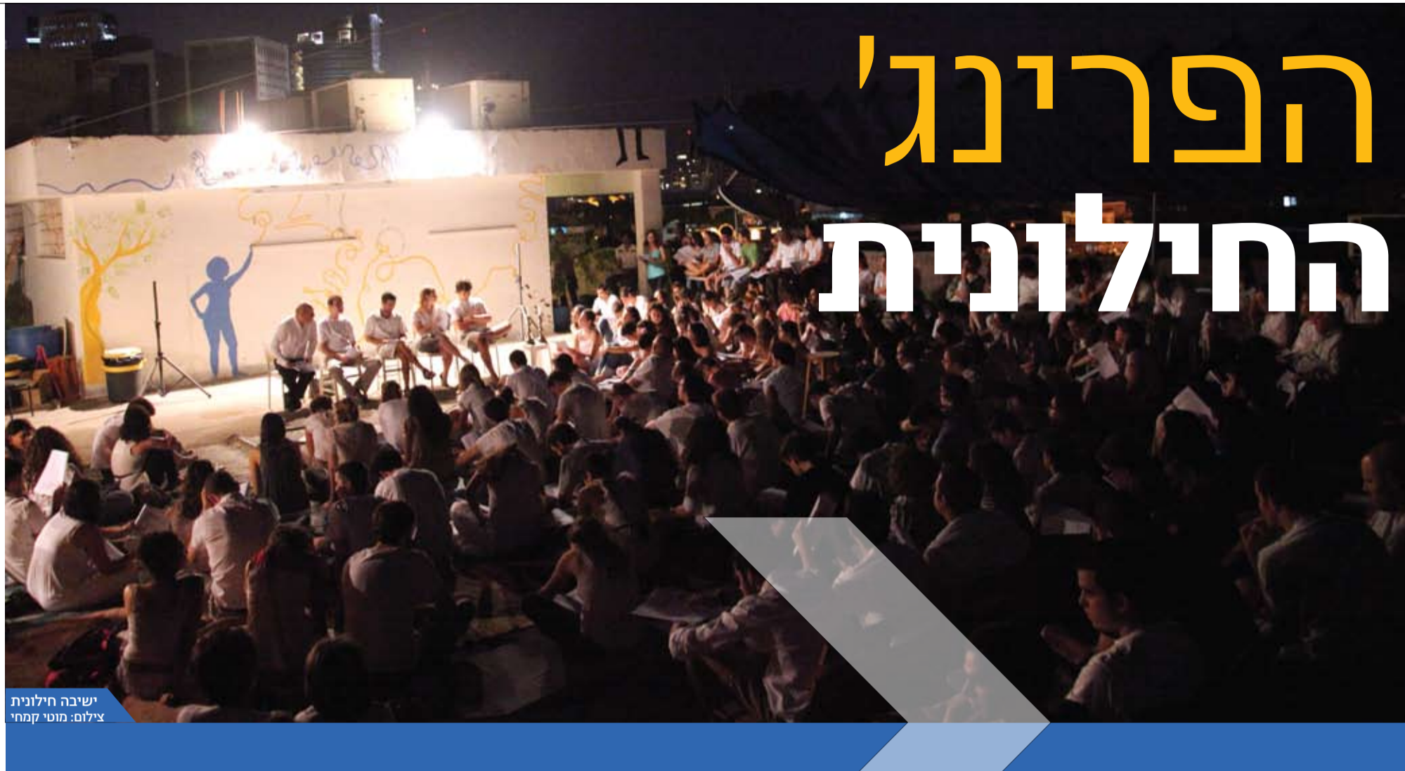
ישיבה חילונית

בישיבה החילונית רואים גם חובה להעמיק בשורשי הזהות החילונית וללמוד - חוץ מהמקרא והמשנה, מסוגיות בתלמוד וסיפורי חז"ל - גם טקסטים מכוונים של הגאורות האירופית וההשכלה היהודית ויצירות ספרות מכוונות של התרבות העברית החדשה