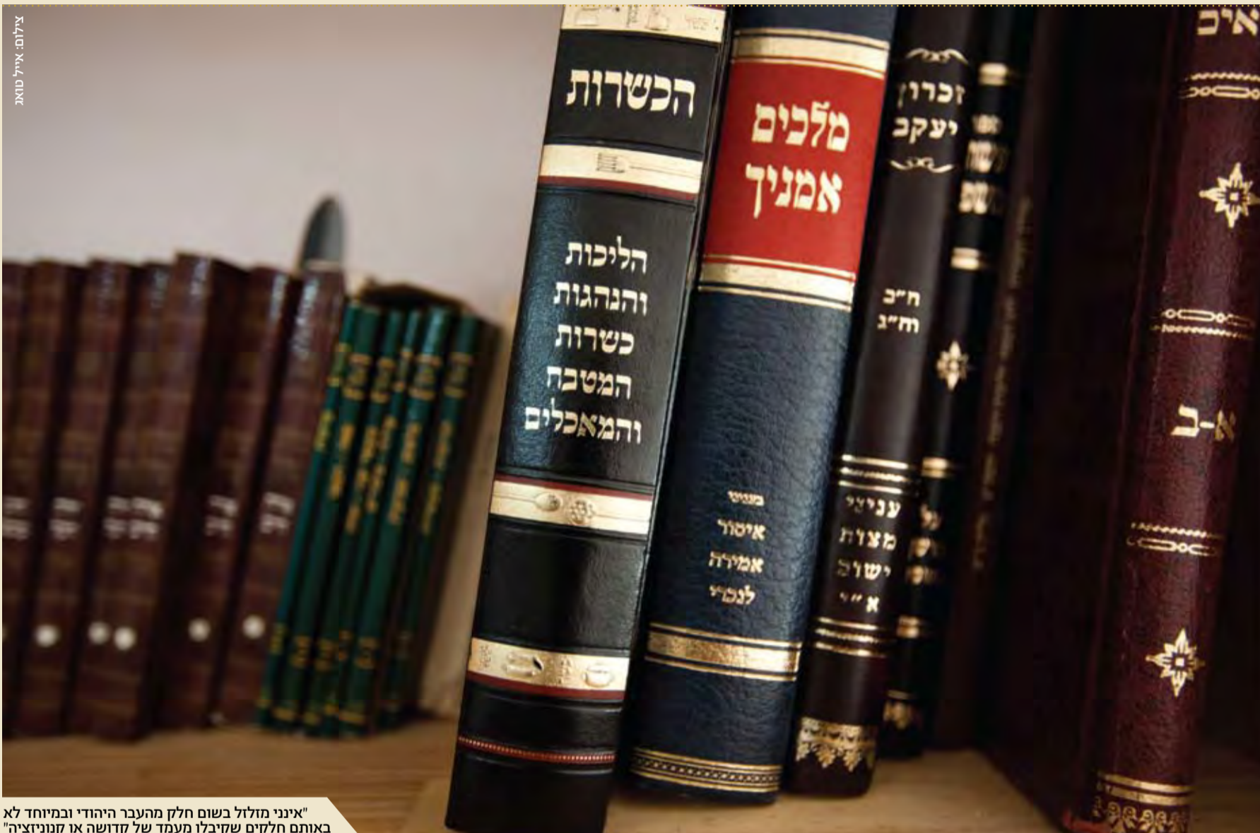
"אינני מזלזל בשום חלק מהעבר היהודי ובמיוחד לא באותם חלקים שקיבלו מעמד של קדושה או קנוניזציה"

התרבות היהודית בכלל, ובפרט במדינת ישראל, מתמודדת ללא הרף עם שאלות קיומיות, מוסריות, ביטחוניות ומדיניות כבדות משקל. לדעתי, אין שום אפשרות